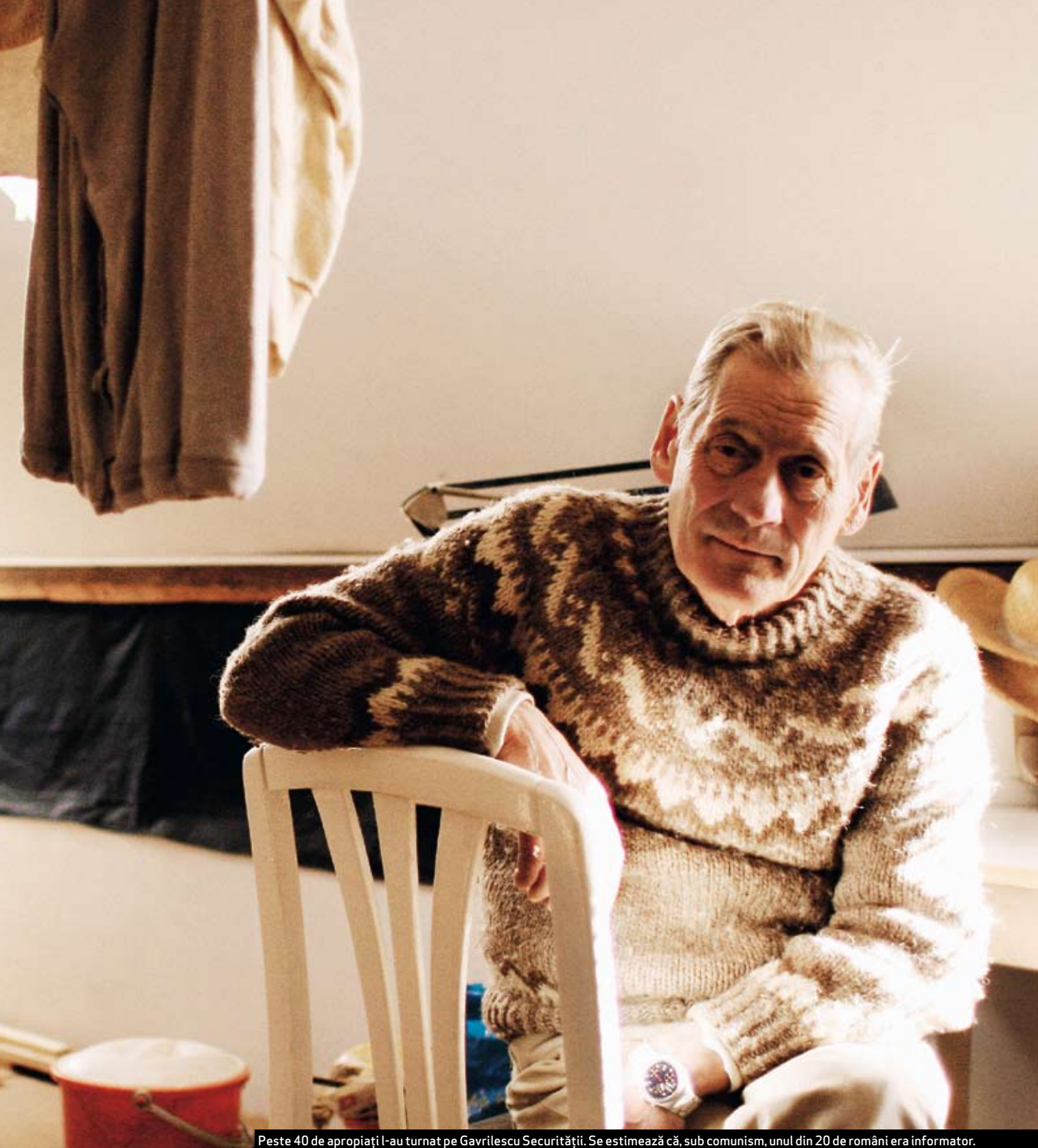
Peste 40 de apropiați l-au turnat pe Gavrilescu Securității. Se estimează că, sub comunism, unul din 20 de români era informator.

mimeze prietenia cu el. Printre ei sunt și toți foștii lui colegi de organizație, descoperiți fără excepție drept colaboratori ai Securității.