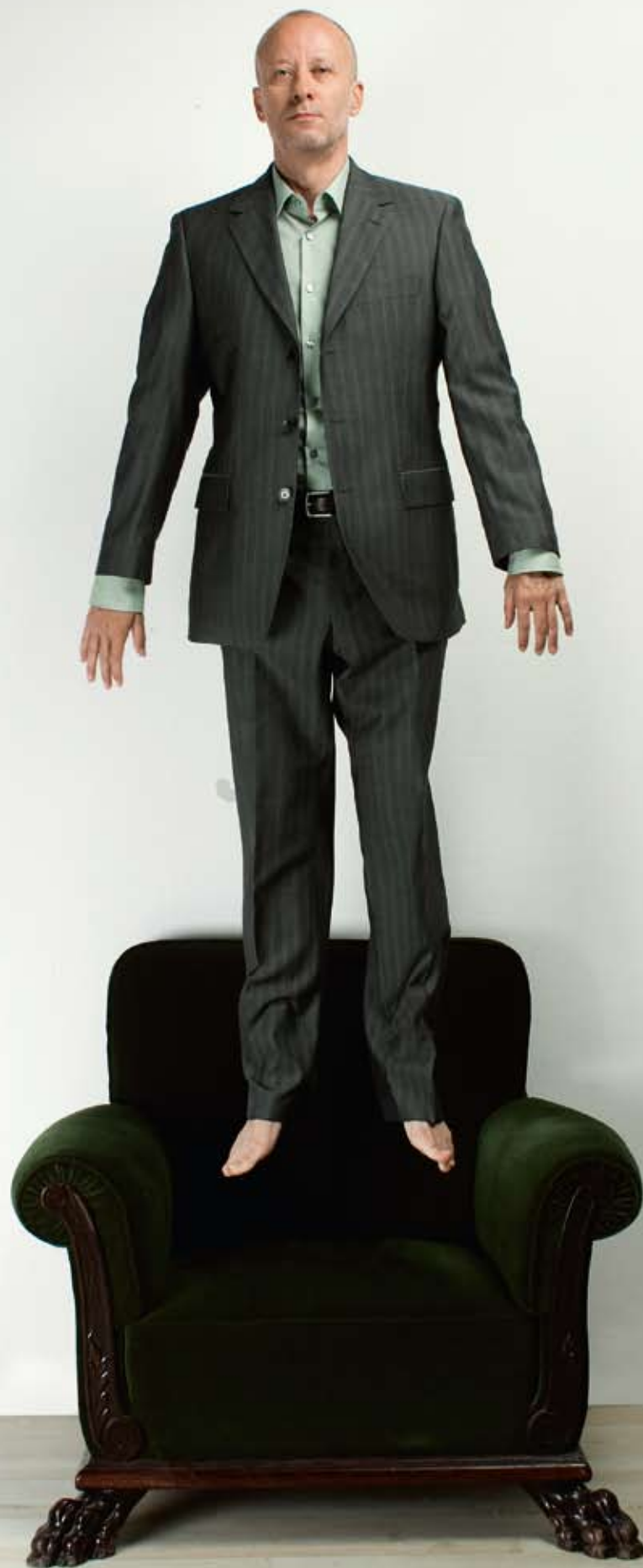
Costum gri cu dungii, Hugo Boss, 2725 lei; Cămașă vernil, Hugo Boss, 370 lei; Curea Hugo Boss, 470 lei.