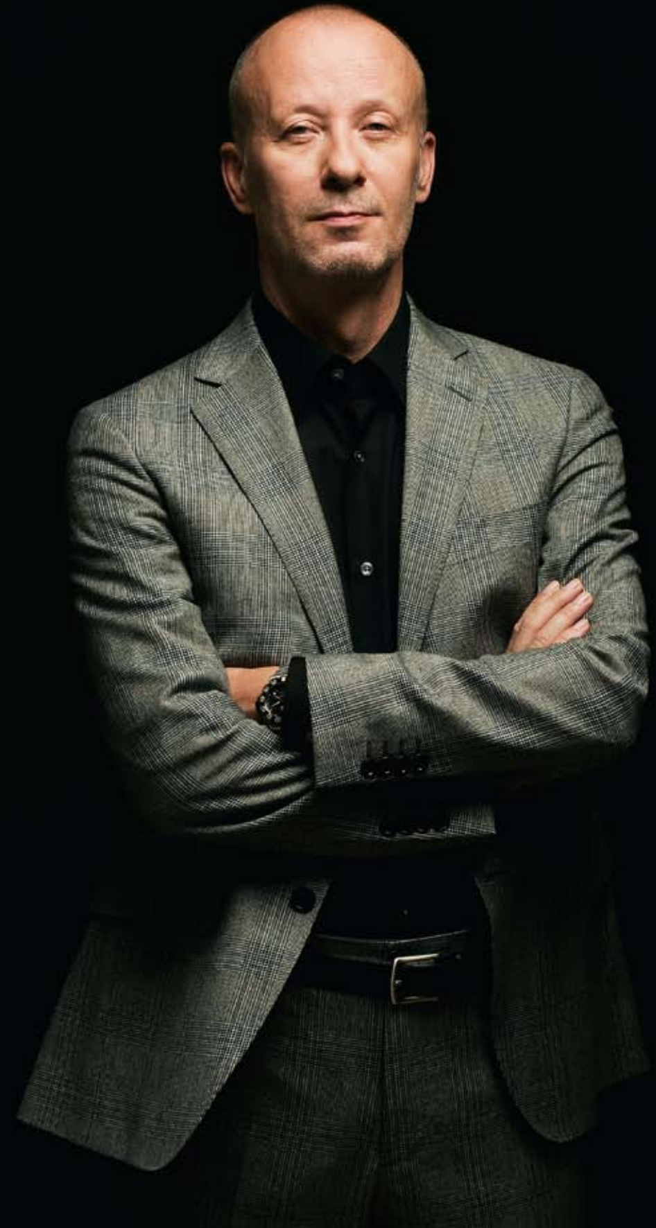
Cămașă neagră, Hugo Boss, 450 lei; Costum Etro, 3700 lei; Curea Hugo Boss, 470 lei;

Cel mai frumos. Singurul lucru important. Singurul lucru care te interesează. Am făcut revoluție de foame, frig și sărăcie. Iar la sărăcie intră sărăcia de libertate. Noi am vrut să mâncăm, să ne fie cald și să fim liberi. N-a fost alt enunț în revoluția română mai important. Toate celelalte au fost după. „Jos comunismul”, „Trăiască capitalismul”. Singurul lucru. Singurul lucru pentru care merită să trăiești. Cu atât mai mult cu cât am trăit în nelibertate, atâta amar de vreme. Suntem obligați să avem grijă de ea. Mare grijă. Suntem obligați să reacționăm. România, dacă n-o să fie atentă, o să devină un stat polițienesc. Stupid și lipsit de orice dimensiune. Un procuror astăzi poate să distrugă pe oricine. Pe noi doi, acum. Poate să ne distrugă pe viață. Dacă el vrea. Și știi că mulți vor? ■